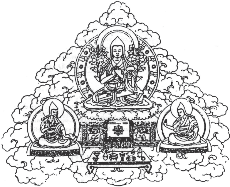
TỔ TÔNG KHÁCH BA (TSONG-KHA-PA, 1357-1419) VÀ HAI VỊ ĐẠI ĐỆ TỬ